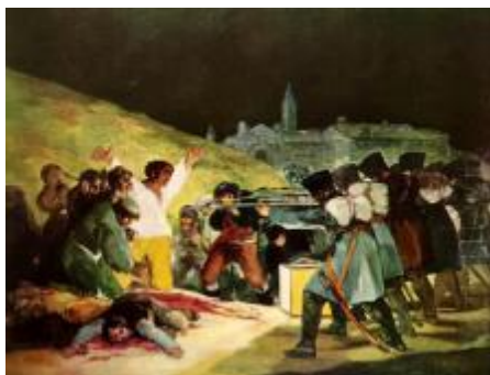
El tres de mayo de 1808: Los fusilamientos en la montaña del Príncipe Pío Francisco de Goya y Lucientes, 1814 Museo del Prado, Madrid